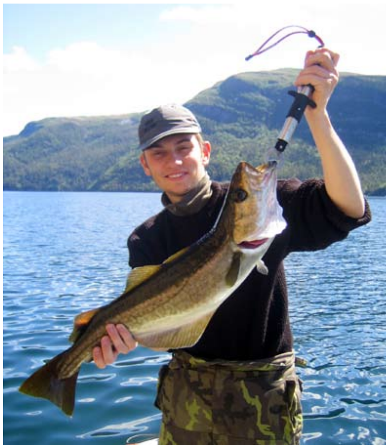
Menší polak (55 – 60 cm) od skal za Tresčí zátokou. Ladík a nový způsob vytahování ryb.

Polak má typický tvar těla jako ostatní druhy tresek. Má tři hřbetní a dvě řitní ploutve. První řitní ploutev začíná hned pod první hřbetní ploutví a je mnohem delší než druhá řitní ploutev. Dolní čelist přečnickává před horní a na rozdíl od mnoha jiných druhů tresek postrádá vousky.