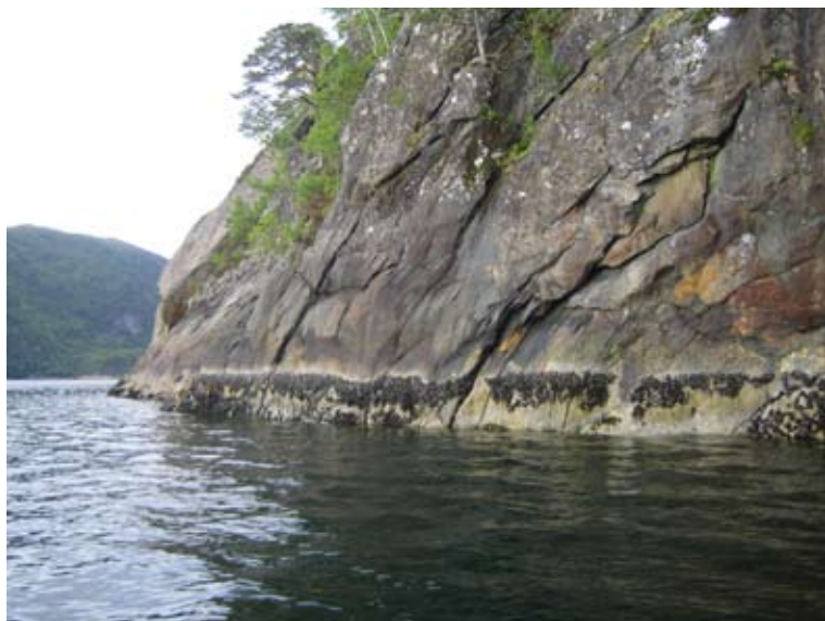
Začátek Polačích skal za odlivu. Tady bývají polaci menší a jen o kousek dál jsou ti obři.

Od té doby jezdím k loďce velmi rád, i když se podobný zážitek ani jednou neopakoval. Přesto jsem u loďky chytil dost pěkných ryb (jiní taky, protože tam pořád oprndává Smyk a Smyková a jak se lze dočíst dále vychytávají to tam řádně). Na druhou stranu je zase hodně lidí, jako např., Mirka, která loďku moc nemusí.