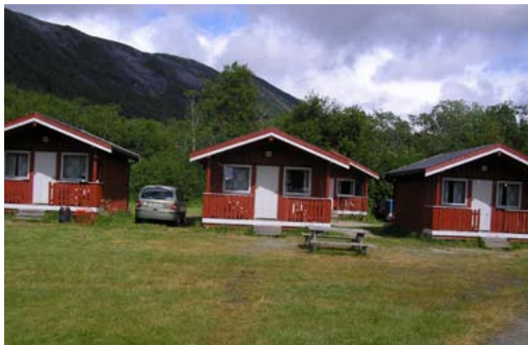
Sem spěcháme. Chatky jsou malé ale útulné a je v nich i v zimě tepla.