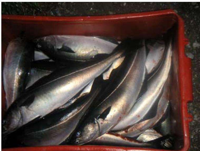
Pěkný úlovek tresek tmavých, standardní velikost kolem 45 cm. Nejlepší na jídlo.

Treska má protáhlé tělo. Dosahuje délky 1,2 m. Spodní čelist je přibližně stejně dlouhá jak dolní. Postranní čára je téměř rovná. Tři hřbetní ploutve jsou srovnány těsně za sebou. První má 13 - 14, druhá 20 - 22 a třetí 19 - 25 ploutevnických paprsků. Dvě řitní ploutve. Ocasní ploutev je široká ale málo vykrojená. Hřbet je zelenohnědý až černohnědý. Břišní strana stříbřitě bílá. Postranní čára je bílá.