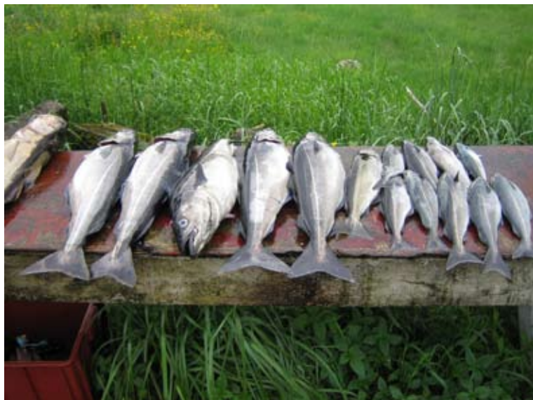
Průměrný úlovek. Stůl má tak 60 cm a ryby z něj přechuhují. Ty menší se zcela běžně chytají na pířka.